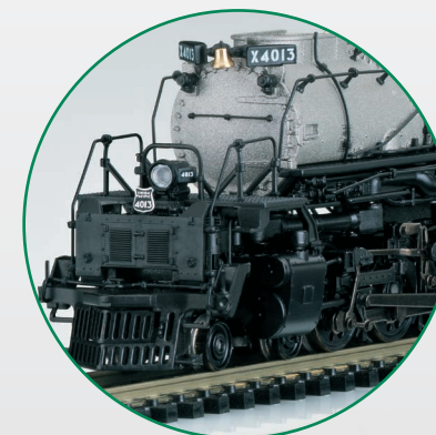
Beeindruckend detailreich präsentiert sich der BigBoy.