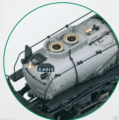
Vorbildgerechter Dampfausstoß über zwei Kamine